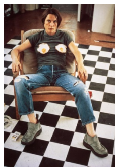
Сара Лукас Аутопортрет с прженим јајима

уметности једне средине у контексту савремене „глобалне“ уметности. Изложба ће кроз уметност данашњице интерпретирати прошлости и поставити следећа питања: ко су жене уметнице и каква је њихова уметност; какав је положај жене у друштву данас; да ли равноправност постоји; како музеј, култура и уметност могу бити место промене свести човека о питању равноправности.